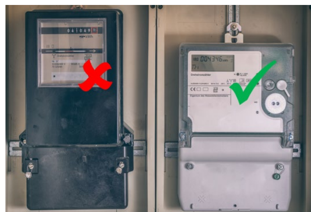
Abbildung 4: Ferraris-Zähler (links), Zweirichtungszähler (rechts).