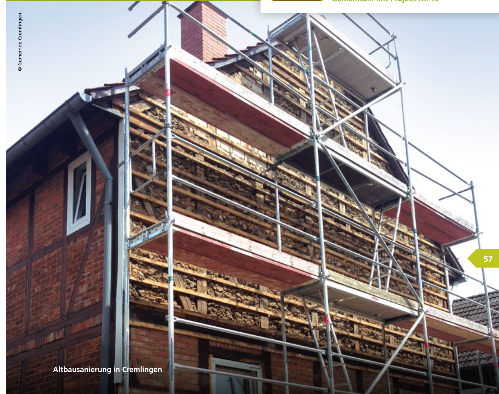
Altbausanierung in Cremlingen