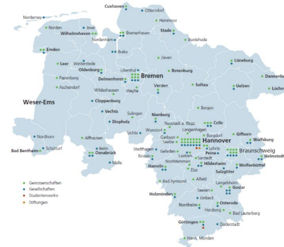
Die Mitgliedsunternehmen im Verbandsgebiet

Mitgliedsunternehmen sind sozial und nachhaltig orientierte Unternehmen, die sich als verlässliche und verantwortungsvolle Vermieter für breite Schichten der Bevölkerung einsetzen und ihnen ein bezahlbares, sicheres und lebenswertes Zuhause bieten.